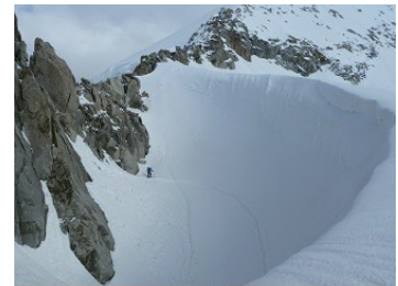
Après le rappel, la corniche

plus proche a été vite écartée, n'ayant pas pu récupérer les clefs à l'office du tourisme. Nous ne commençons donc qu'à 9h passées notre loooongue montée, qui débute de plus par un portage de 600m. Mais nous finissons par rencontrer la neige et nous poursuivons vaillamment, skis aux pieds, notre montée sous un soleil radieux. Après une rapide pause pique-nique, c'est la première descente vers le glacier Minstigerletscher que nous