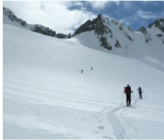
En montant vers la Gamlilicke

Samedi 5 mai, journée « warrior » : Plus de 2000m de dénivelé prévus pour atteindre notre refuge (ce sera finalement plus de 2300m!!) : une grosse journée nous attendait. De plus, suite à une incompréhension, le car a loupé la première dépose et a donc fait un aller retour Betten/Brig de 20km supplémentaires. Bref, nous avons été déposés les derniers vers 8h30 à Münster, notre lieu de départ à 1390m d'altitude. La possibilité d'écourter cette première journée en dormant dans un refuge non gardé beaucoup