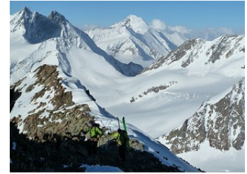
La petite arête où nous déchaussons

sont déjà parties) à 5h et départ à 6h. Montée efficace (avec les couteaux) et bientôt, nous arrivons vers 3600m au passage d'une petite arête où il faut déchausser. Nous reprenons notre montée entre séracs et crevasses, l'altitude commence à se faire sentir et quelques nuages se mettent à bourgeonner. Mais nous arrivons sans