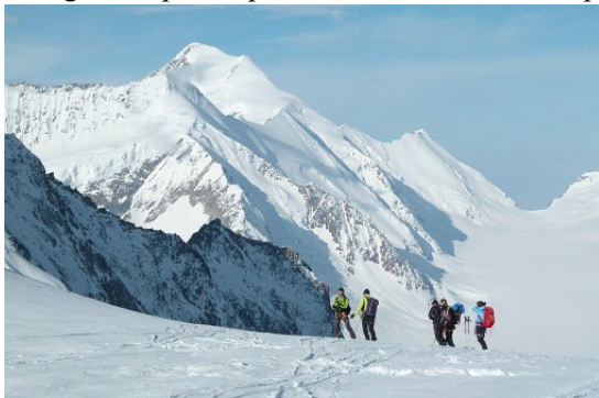
Dernière journée au milieu des glaciers de l'Oberland

Une grande pierre plate nous accueille tous pour un pique-nique au soleil, et nous entamons les 8km de