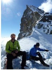
Au pied de l'arête finale

encombre vers 9h et demi à Huginstättel, la selle neigeuse à 4088m d'altitude, au pied de l'arête finale. Pour trois d'entre nous, c'est suffisant et c'est donc à quatre que nous