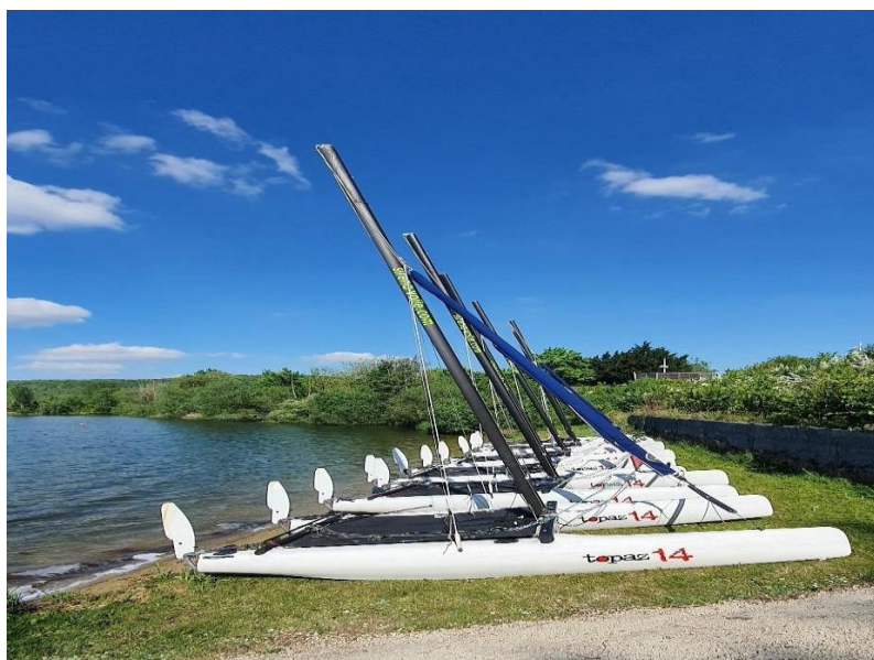
Catamarans Topaz 14